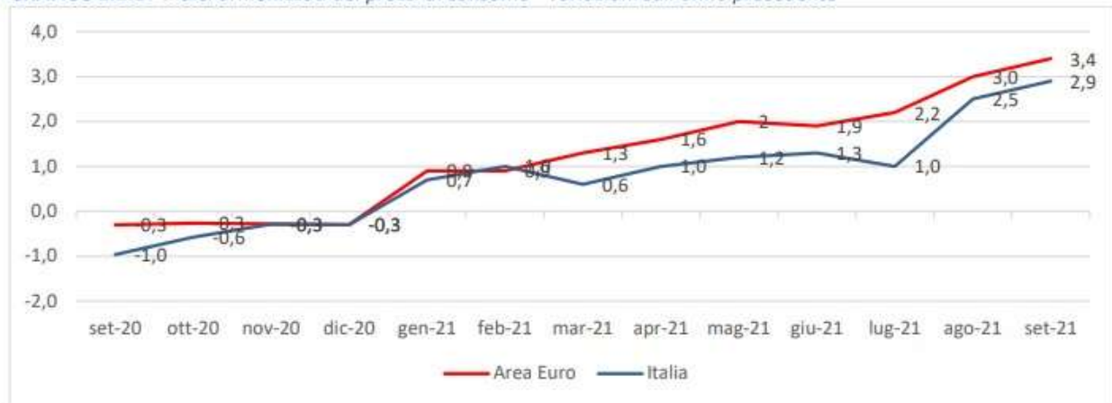
GRAFICO 1.1.1 - Indici armonizzati dei prezzi al consumo - variazioni sull'anno precedente